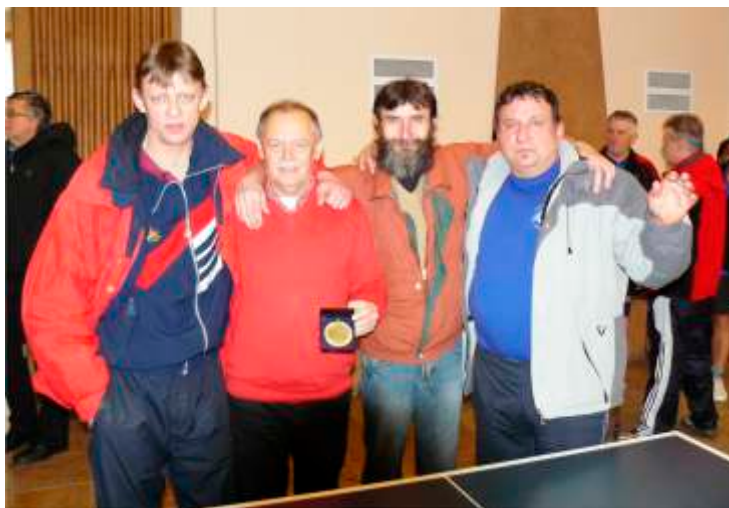
Stolný tenis región BZVB Hrádok

X – dni prac. voľna, Oo – ostatný odpad, PI – plastový odpad