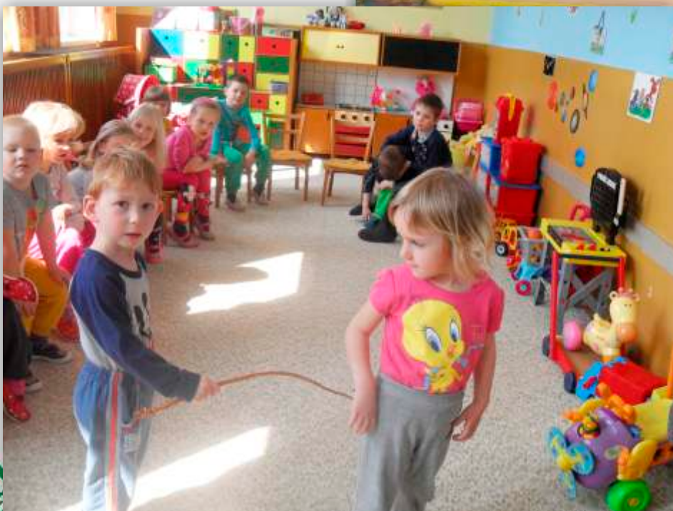
Deti z materskej školy