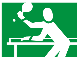
Stolný tenis Lúka