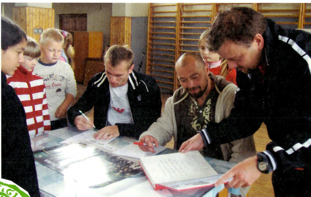
Beseda s hokejistami