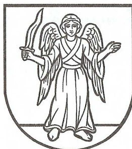
Erb obce Pobedim

Pečatidlo obce pochádza z 18. stor. a jeho odtlačky sa zistili na dokumentoch z rokov 1844 - 1852. Historickým symbolom Pobedima je sv. Michal archanjel - patrón rímsko-katolíckeho kostola v Pobedime.