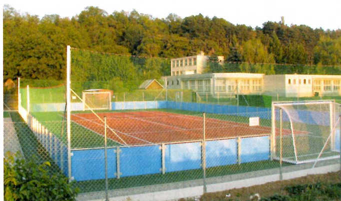
Multifunkčné ihrisko 33 x 18 m s oplatením.