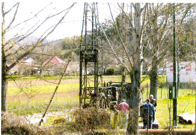
Navrtanie studne na polievanie ihriska.