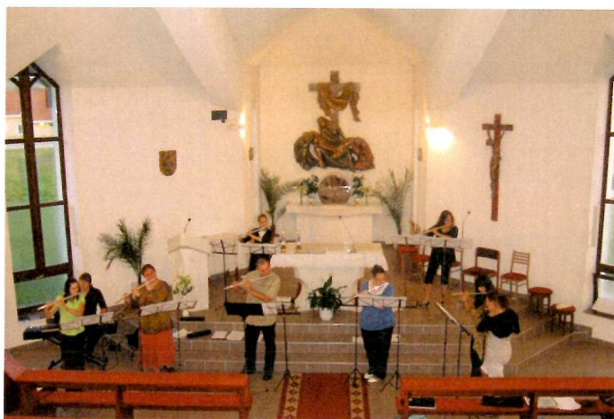
Flautový koncert v kostole.