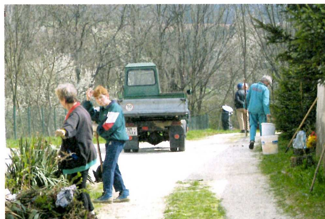
Brigáda dôchodcov na úprave cintorína.