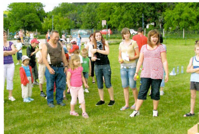
Športové popoludnie k MDD.