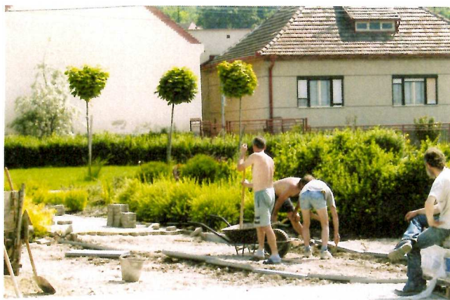
Rozšírenie chodníka a odvodnenie plochy pred kostolom.