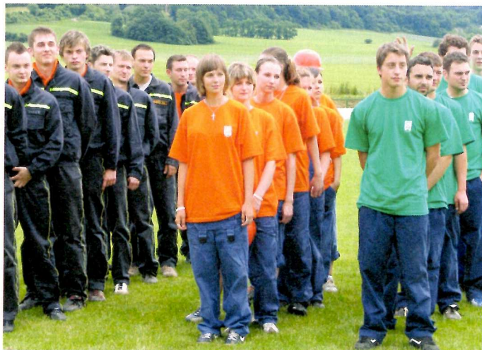
Regionálna súťaž DHZ v Novej Vsi nad Váhom - družstvo žien 1. miesto, muži 7. miesto.