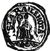
Pečať Starej Lehoty na písomnosti z roku 1771

V zelenom štíte na striebornej pažiti stojaci strieborný, striebrovlasý, zlatobradý biskup - sv. Mikuláš - v striebornom, zlato lemovanom rúchu v pravici so zlatou priklonenou berlou, v ľavici pred sebou s tromi zlatými guľami na zlatej knihe.