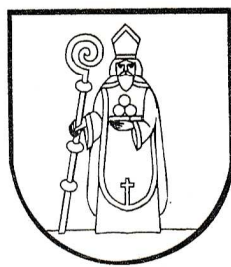
Erb obce Stará Lehota