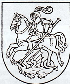
Erb obce Podolie

Historický symbol obce súvisí s patrocíniom rímsko-katolíckeho kostola v Podolí, ktorý je zasvätený sv. Jurajovi. Od tlačok pečatidla obce s rokom vyhotovenia 1743 sa zachoval na písomnostiach z rokov 1773 - 1783. Svätého Juraja na koni mala vo svojej pečati aj obec Korytné, ktorá sa v roku 1957 začlenila do Podolia.