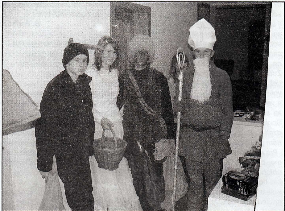
Tradície ešte nezanikli. Mikuláš s anjelom a čertom chodili rozdávať darčeky deťom.

Rezkým krokom sa náhlila ulicami – jeden obchod, druhý, pošta, lekáreň... Hlavou sa jej premietali povinnosti, ktoré bolo treba vybaviť. Zrazu zbadala, že neďaleko stojí ďalší z nich. No u nich na dedine sa vôbec nenachádzajú, tento problém je vidiečanom vzdialený. Nohy jej akosi automaticky začali spomaľo-