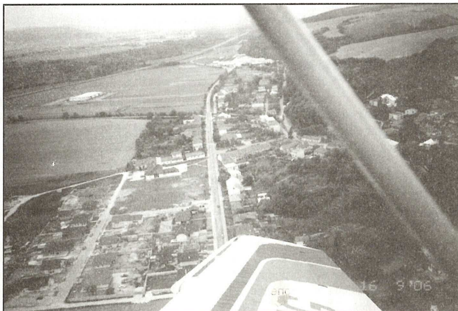
Atraktívny pohľad sa vyskytol ľuďom, ktorí využili vyhliadkový let nad dedinou

Cola v decembri roku 1999 sme vlastnícky prebrali vodný zdroj Šáchor spolu s obcou Modrovka, ktorý doteraz prevádzkujeme. Ďalej tu máme prevádzku Chirana, Rekreačné zariadenie MV SR, kde sa teraz nachádzame, prevádzku potravín Jednota, súkromné prevádzky služieb a dopravy, dokončuje sa i stavba nového závodu plniarne nealkoholických nápojov. Boli vytvorené dobré podmienky na výstavbu rodinných domov, kde obec zabezpečila pozemky, infraštruktúru rozvodov elektrickej energie, plynu a vody. Postavili sme nájomný bytový dom 8 b. j., druhý je vo výstavbe. V nových stavebných obvodoch začali vyrastať nové pekné rodinné domy. Rozšírili sme verejné osvetlenie, vybudovali sme rozšírenie cintorína, opravili sme časť miestnych komunikácií a veľa ďalších aktivít, ktoré budete mať možnosť pozrieť si z videozáznamu v podvečer našich osláv. Obecný majetok počas 10 rokov